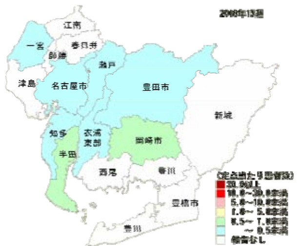
図3 保健所別インフルエンザ定点当たり報告数(2010年15週)